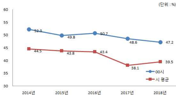
유사 지방자치단체와 재정자립도 비교