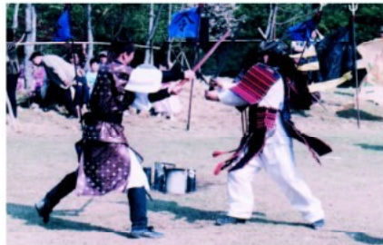
아산 성웅 이순신축제