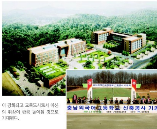
이 강화되고 교육도시로서 아산의 위상이 한층 높아질 것으로 기대된다.

외국어고등학교가 개교되면 지역의 우수한 인재들이 타지역으로 나가는 것을 막고 외국어 능력을 갖춘 글로벌 인재양성의 중심지로서의 역할을 충실히 해낼 것으로 예상되며 지역발전과 도시경쟁력