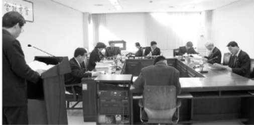
▲ 총무복지위원회 업무보고