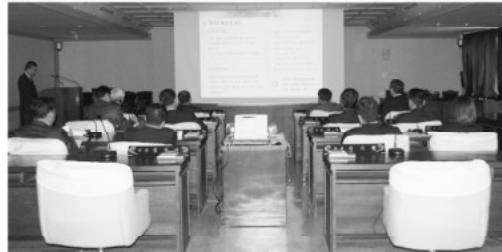
▲ 아산시 도시기본계획(안)에 대한 의견요청 청취(부의장)