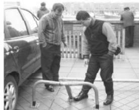
▲네덜란드 주저금지시설 벤치마킹