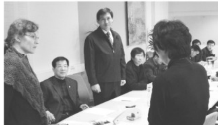
▲스톡홀름시 교육청 방문

이번 연수를 통하여 얻은 성과는 ▶도시계획 ▶건축 ▶농업 ▶자전거도로 ▶교육복지 분야로 나누어 보고서 작성을 추진 중에 있으며, 작성된 보고서는 자료실에 비치하고 의회홈페이지를 통해 게시할 예정이며, 향후 아산시정에 적극 반영할 계획이다.