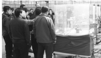
▲덴마크 코펜하겐 대학 방문