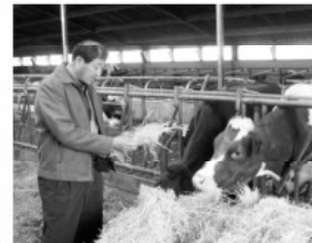
▲네덜란드 축산농가 방문