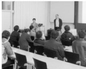
▲덴마크 코펜하겐 대학 방문