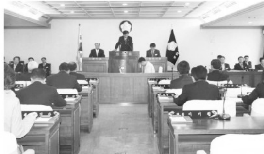
▲ 아산시의회 제112회 임시회가 4월 16일부터 4월 20일까지 5일간 개최되었다.

음식물 감량화 의무사업장 기준을 현행 250㎡에서 125㎡이상으로 기준을 강화하고, 남부집중 구입처를 현행 읍·면·동사무소에서 공공계 상주 판매소까지 확대하여 음식물쓰레기 감량화 및 재활용율을 높이고, 시민 편의를 증대시키기 위하여 조례를 일부 개정