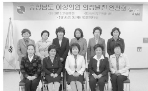
▲ 충청남도 여성의원들이 하자리에 모였다