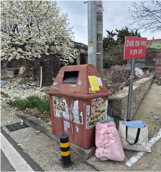
아산시 신창면 읍내길 22-1 (반석원룸 맞은편 주차장)