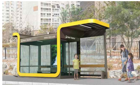
안심쉼터 설치 안