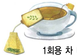
1회용 차 티백 한약재 찌꺼기