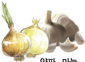
양파, 마늘, 생강, 옥수수 등의 껍질