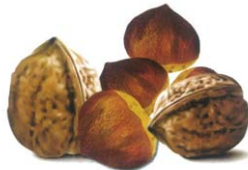
견과류 껍데기 과실류의 "씨"