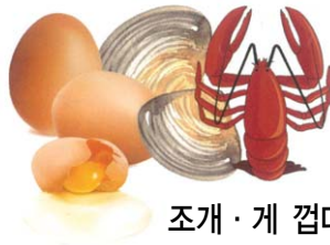
조개·게 껍데기 계란 껍데기