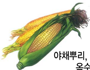
야채뿌리, 줄기 옥수수대