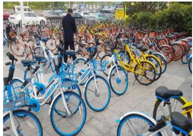
△ 도심 곳곳에 비치된 공유자전거