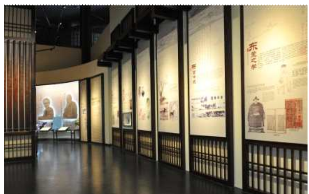
△ 동관전람관 문화관