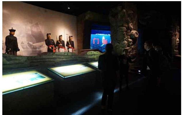
△ 동관전람관 역사관