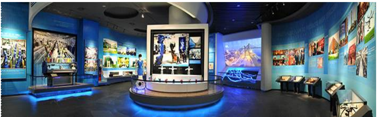
△ 동관전람관 경제관