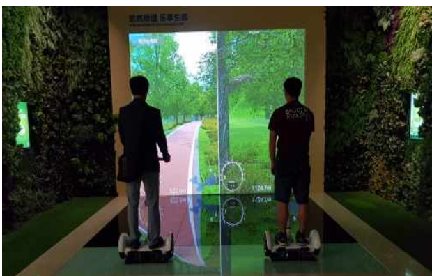
△ 동관전람관 도시관