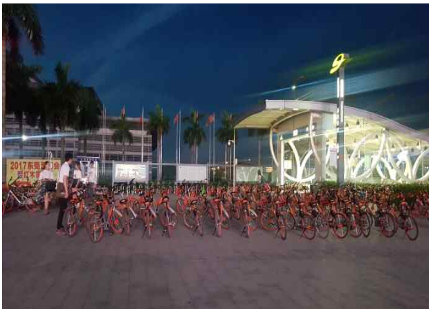
△ 지하철 출입구의 공유자전거