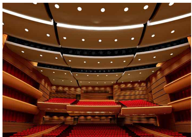
△ 동관 올란 그랜드 극장 관람석