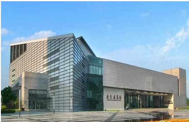
△ 동관전람관 전경