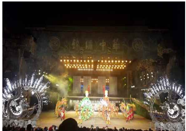
△ 금수중화민속촌 공연 관람