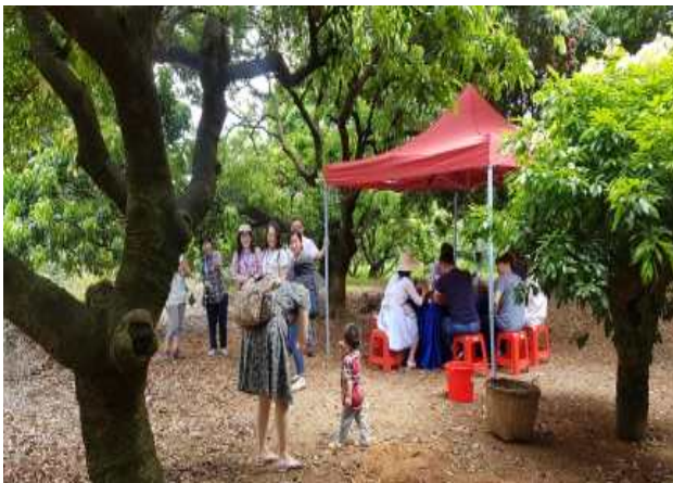
△ 송산호 리치농장 리치 수확 체험