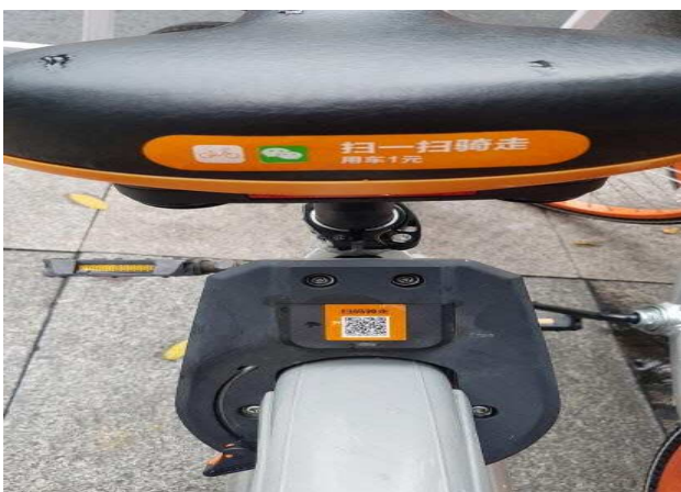
△ 공유자전거 MOBIKE (자동 잠금 해제)