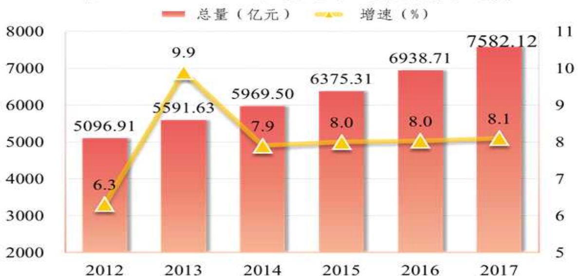
▲ 2012-2017 동관시 지역총생산 및 성장속도