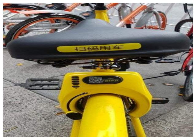
△ 공유자전거 OFO (자동 잠금 해제)