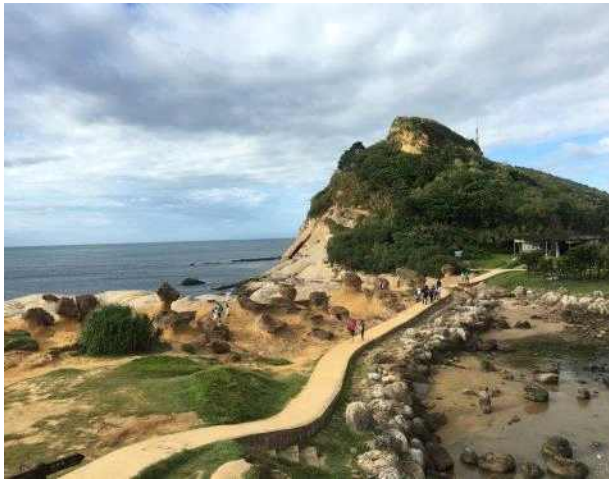
예류 해양지질공원 전경