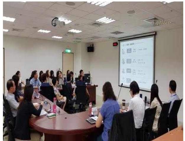
타이페이시청 운영현황 청취 중