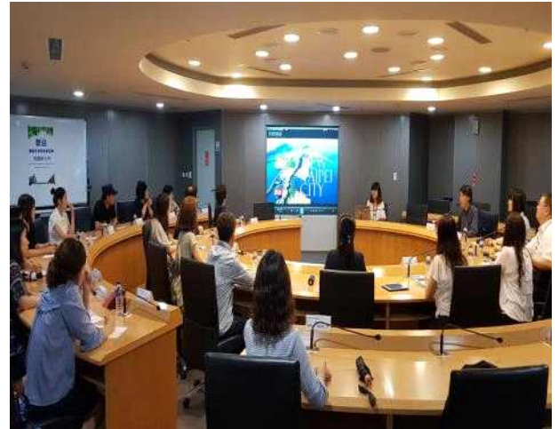
신베이시청 운영현황 청취 중