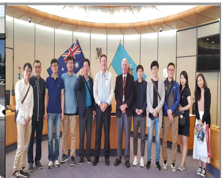
- 블랙타운시청 질의 2 -