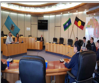
- 블랙타운시청 질의 1 -