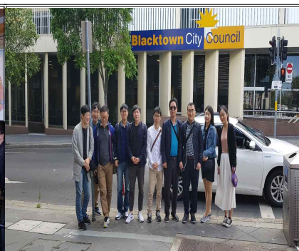
- 블랙타운시청 방문 -