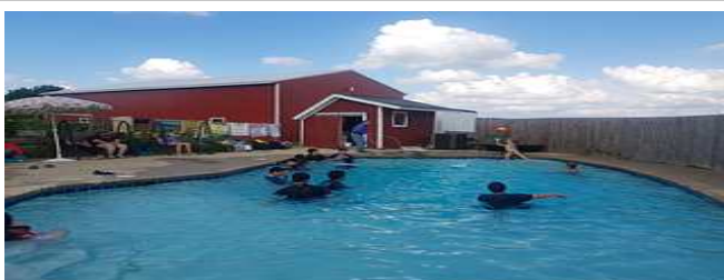
현지 홈스테이 환경