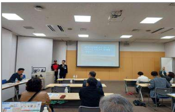
오사카시 니시요도가와구 방재 브리핑