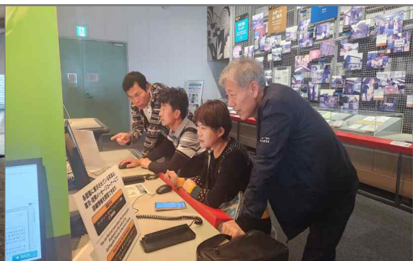
교토시 시민방재센터 견학