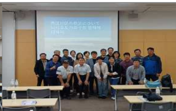
오사카시 니시요도가와구 기념촬영