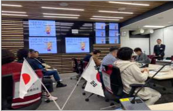
나라현 방재통괄실 브리핑