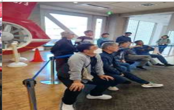
교토시 시민방재센터 브리핑