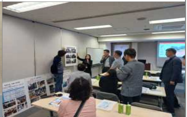
교토시 재해볼란티어센터 활동 청취