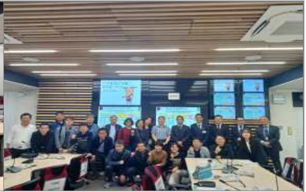
나라현 방재통괄실 방문 기념촬영