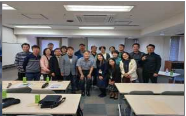
교토시 재해볼란티어센터 방문 기념촬영