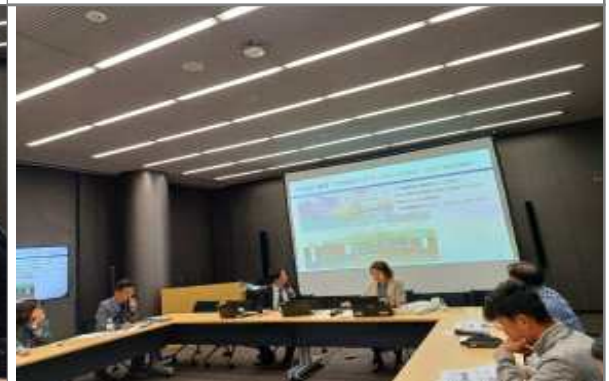
고베시 사람과 방재 미래센터 질의응답