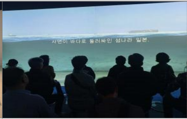
고베시 위기관리실 견학