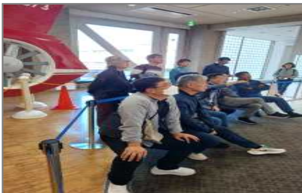
교토시 시민방재센터 견학