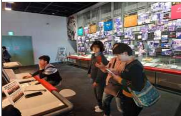
교토시 시민방재센터 견학