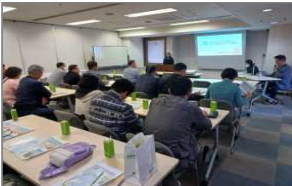
교토시 재해볼란티어센터 브리핑