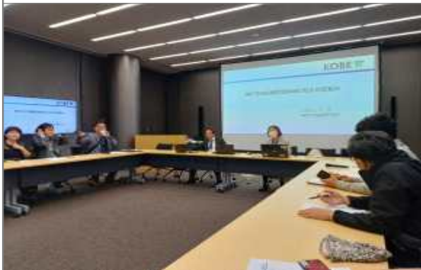
고베시 사람과 방재 미래센터 브리핑