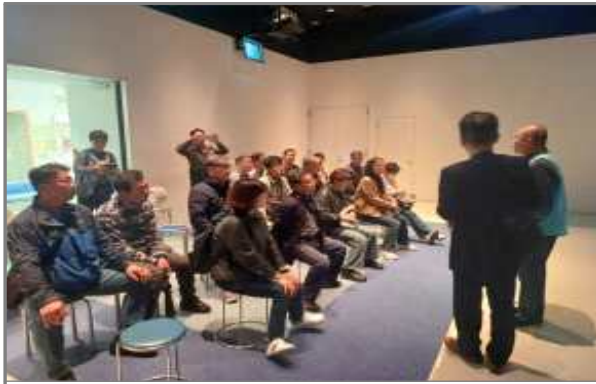
고베시 위기관리실 브리핑