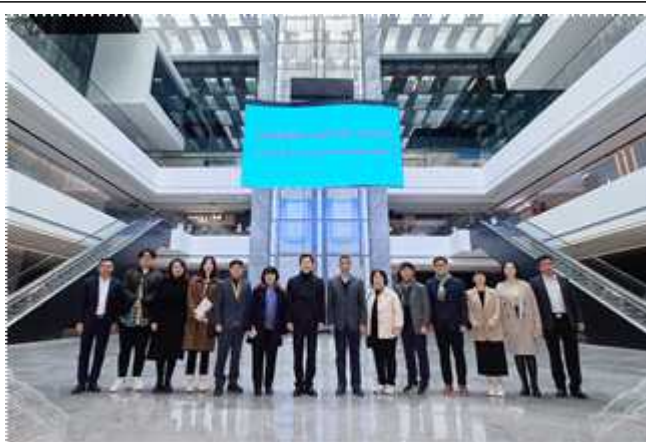
수면산업 관련 기업 방문

○ 두 도시의 공통적인 핵심 산업시설인 삼성 디스플레이 사업장을 방문, 생산 라인 시찰과 홍보관 견학을 통해 아산 사업장과의 협력 방안 모색