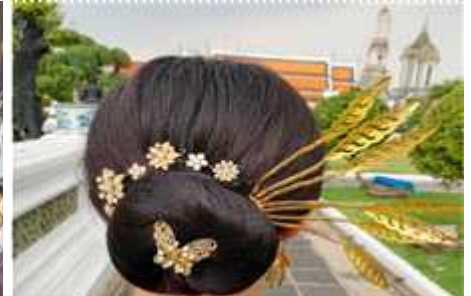
▲ 전통의상 및 헤어 체험