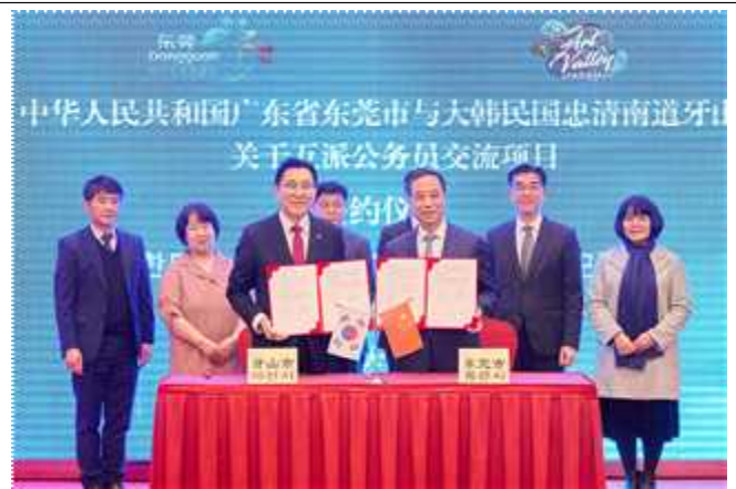
공무원 파견 프로그램 MOU 체결