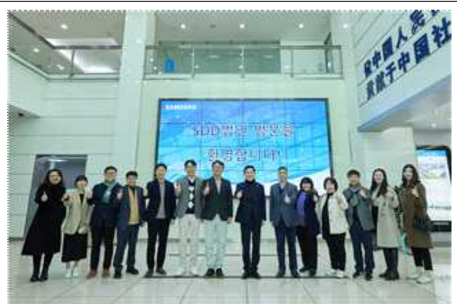
삼성 디스플레이 동관 사업장 방문