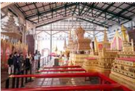
▲ 장례 마차