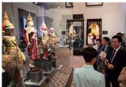
▲ 전통 의상