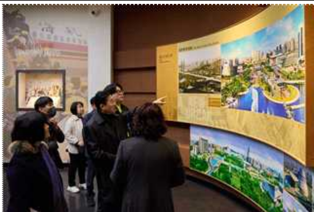
동관 전시관 견학