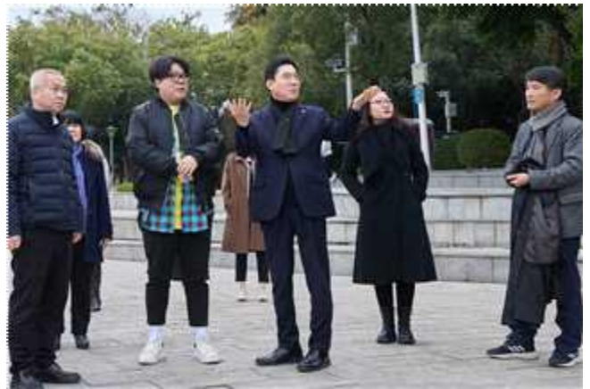
송산호 야외음악당 방문