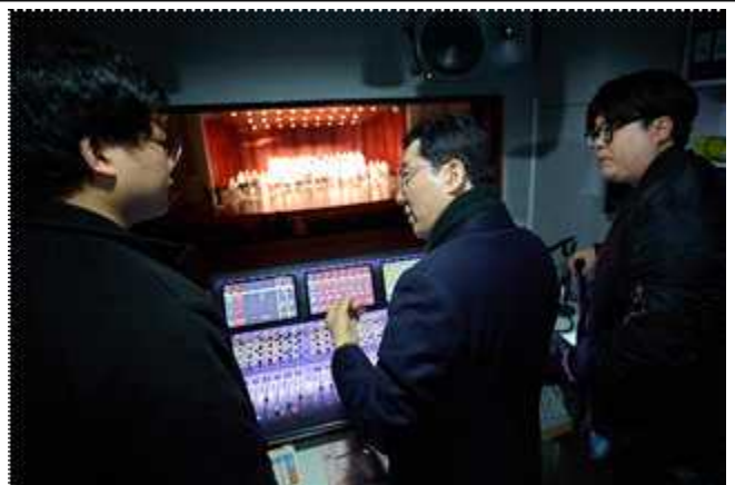
동관 옥란대극장 견학