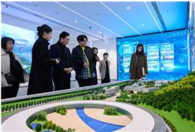
송산호수 과학단지 전시관

○ 우리시 중점 공약사항인 신정호 국가·지방정원 지정을 위한 선진 정책의 벤치마킹의 일환으로 동관시 최대 호수인 송산호수와 그를 중심으로 설계된 송산과학단지 및 전시관을 방문, 시민들의 여가 공간이자 문화예술 및 첨단과학 중심지로 발돋움하는 호수공원 조성 정책 견학