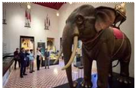
▲ 전시 활용 코끼리