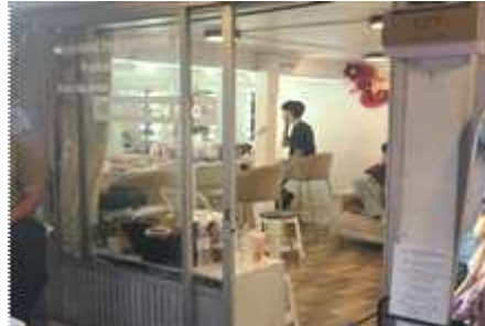
▲ 전통의상 대여소(헤어 디자인 서비스 운영)