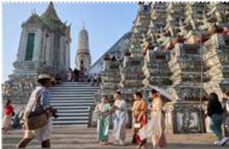
▲ 전통의상 체험 관광객