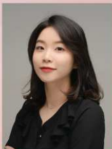
Organ 김 새 날