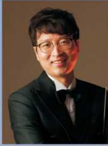
지휘자 안 상 목